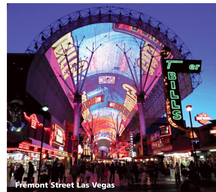
Fremont Street Las Vegas

Die heutige Fahrt führt Sie in den fantastischen Valley of Fire State Park, der in völliger Einsamkeit, nicht weit entfernt von Las Vegas liegt. Im Valley of Fire State Park erhalten Sie einen Eindruck vom unver-