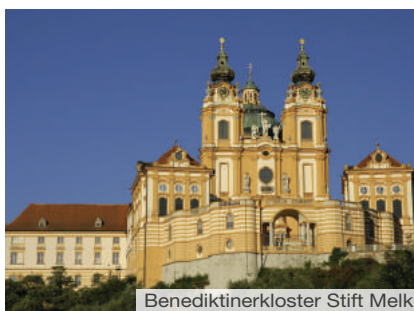
Benediktinerkloster Stift Melk