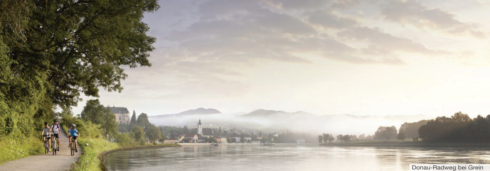
Donau-Radweg bei Grein