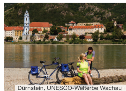
Dürnstein, UNESCO-Welterbe Wachau