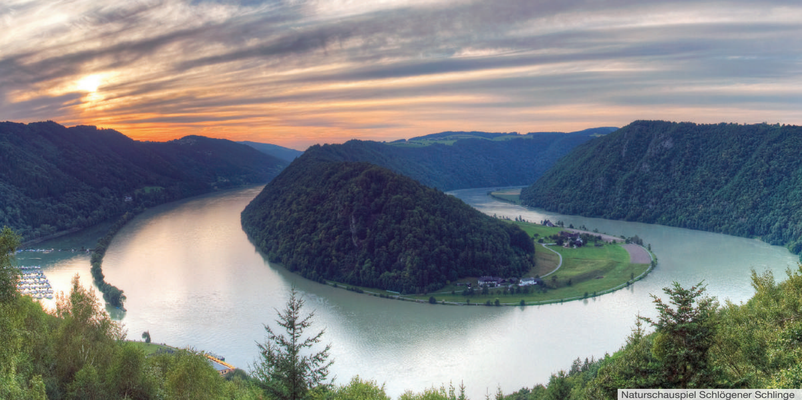
Naturschauspiel Schlögener Schlinge