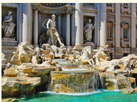
Der berühmte Trevi-Brunnen