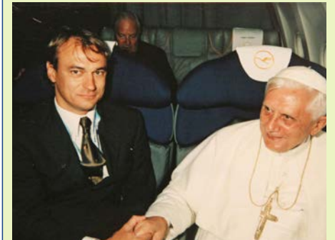
... und Papst Benedikt