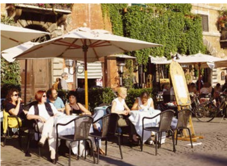
Entspannende Momente im Straßencafe