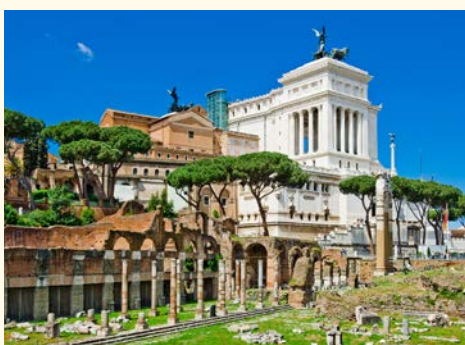
Nationaldenkmal für König Viktor Emanuel II.