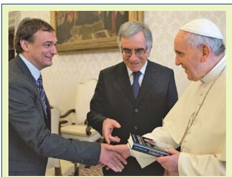
Mit Papst Franziskus...

Nach diesen eindrucksvollen Tagen heißt es „Arrivederci Roma“. Im Laufe des Tages werden Sie zum Flughafen gebracht und fliegen zurück nach Deutschland..