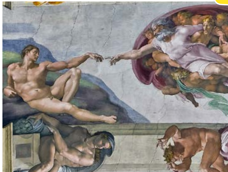
„Die Erschaffung Adams“ von Michelangelo