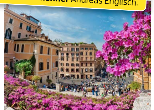
Piazza di Spagna

16.11. - 19.11.2017 • Flug ab/an Frankfurt • ab € 1.195,- p.P. im DZ