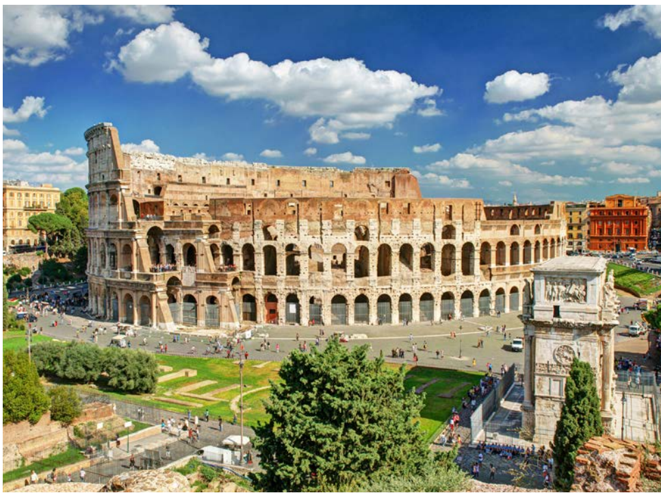
Das Kolosseum in Rom