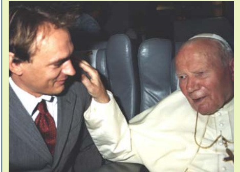
Papst Johannes Paul...