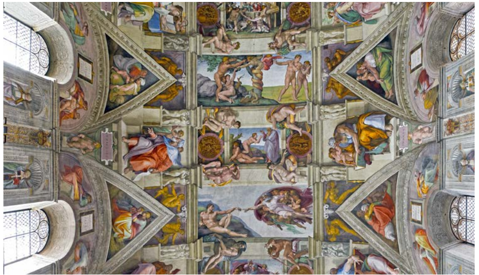
Deckenfresken in der Sixtinischen Kapelle