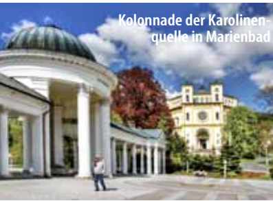
Kolonnade der Karolinenquelle in Marienbad