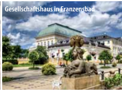
Gesellschaftshaus in Franzensbad