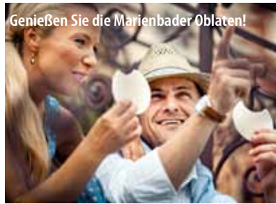
Genießen Sie die Marienbader Obläten!