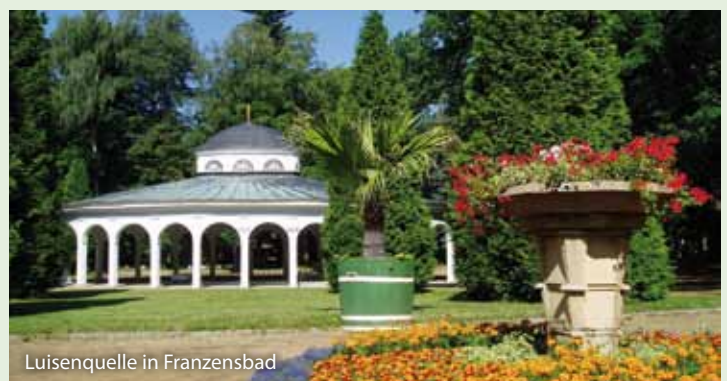
Luisenquelle in Franzensbad