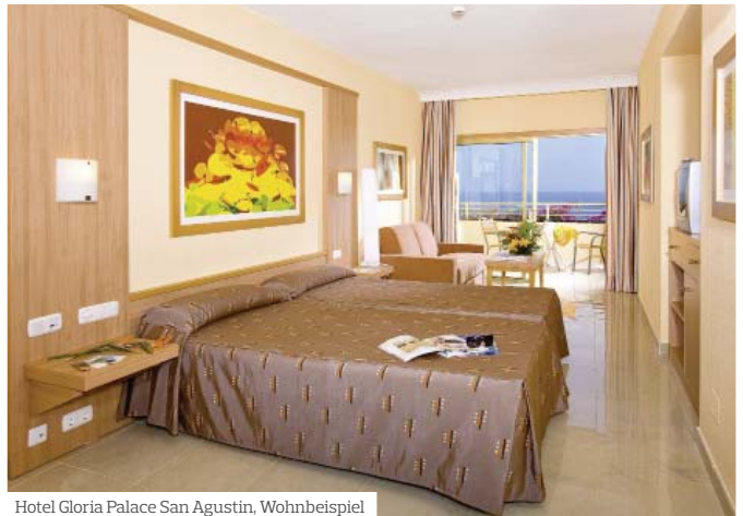
Hotel Gloria Palace San Agustin, Wohnbeispiel