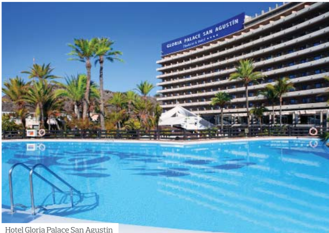
Hotel Gloria Palace San Agustin