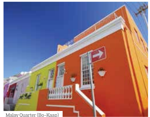
Malay Quarter (Bo-Kaap)